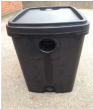
Tulo on ylempi, jossa on vain yksi holkki