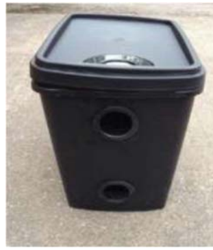
Ilmanvaihto on ylempi ja ulostulo on alempi.