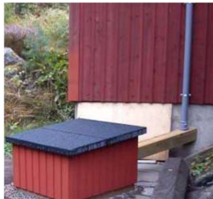
Ilmastointi katolle ja ulostuloputkessa.